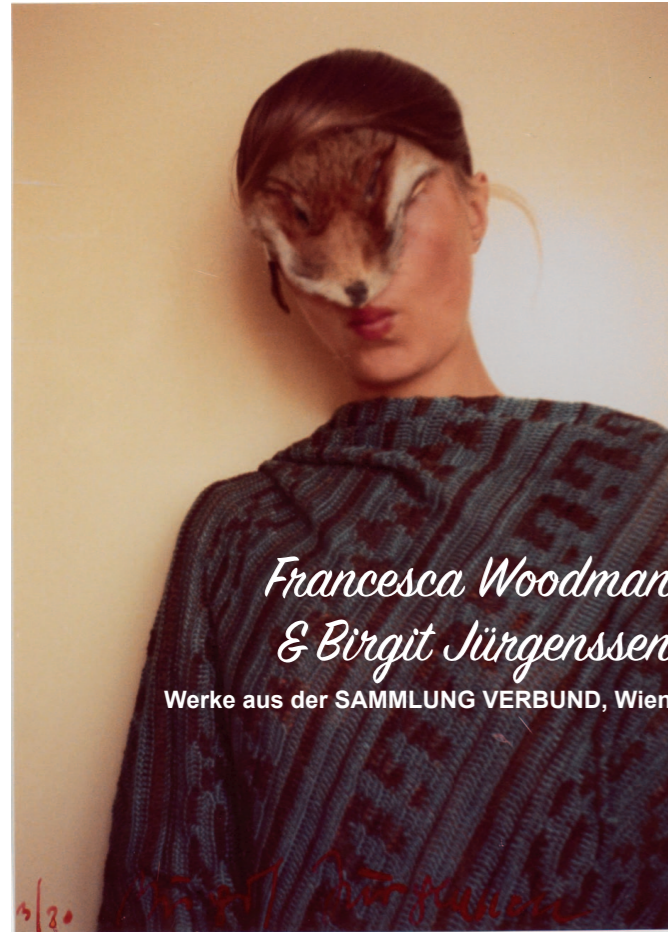
Francesca Woodman & Birgit Jürgenssen