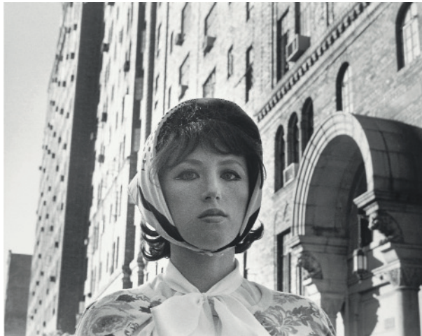
Cindy Sherman, Untitled Film Still # 17 , 1978 © Cindy Sherman / Sammlung Verbund, Wien Courtesy Metro Pictures, New York

Die Entdeckung des eigenen Körpers als Ausdrucksmittel in den 1970er Jahren stellt wesentliche Themen wie die Frage nach und die Konstruktion von Identitäten, die Zersplitterung des Subjekts, Rollenspiele, Selbstinszenierung, Emanzipation und feministisches Aufbegehren zur Diskussion.