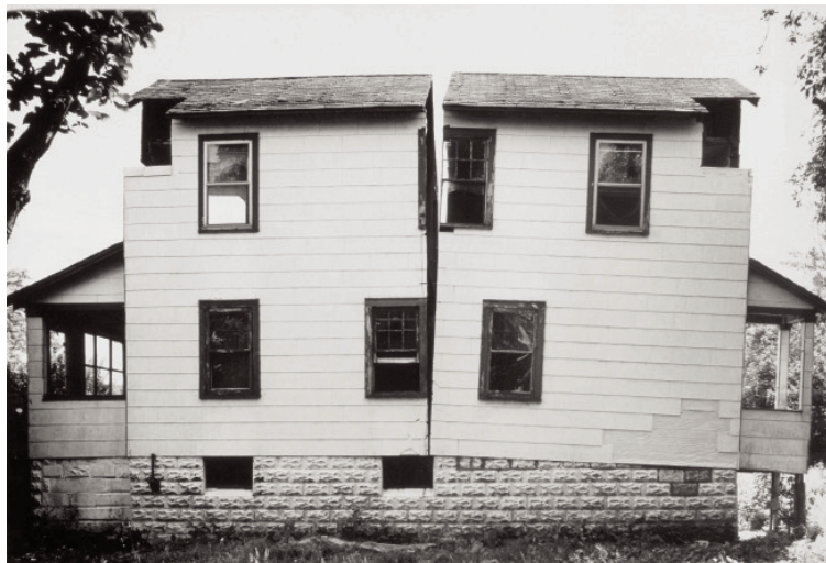
Gordon Matta-Clark, Splitting: Exterior, 1974, Ausschnitt

Zeitlich parallel zur "performativen Wende" entstand ein neues Verständnis für den Umgang mit dem Phänomen Raum. Während Gordon Matta-Clark in Splitting (1974) ein Haus in zwei Teile teilt oder in Conical Intersect (1975) durch zwei Häuser eine riesige Kegelform schlägt, gibt er dem Raum eine völlig neue Identität. Fred Sandback hingegen begegnet dem Raum kontemplativ und schafft mit seinen aus feinen Fäden bestehenden Skulpturen scheinbar greifbare Flächen - einen imaginären Raum (imaginary space). Eine ganz andere Raumerfahrung erzeugt wiederum Ernesto Neto durch seine käfigartige, organisch geformte Installation Tractatus IDEuses (2005).